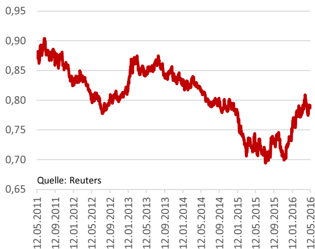
EUR vs. GBP*

Nachdem die Fed bei ihrer letzten Sitzung im April auch einen Zinsschritt im Juni quasi ausschließt, kann der US-Dollar nicht mehr zulegen. Zahlen zu Industrieproduktion, Verbraucherpreisen und BIP aus der Euro-Zone könnten in den nächsten Tagen für etwas Bewegung beim Währungspaar EUR/USD sorgen. Im Bereich 1,15 wird die Luft für den Euro allerdings dünn, weil wirklich positive Impulse für die heimische Währung fehlen. Das Hauptinteresse der Marktteilnehmer gilt heute der Zinssitzung in England. Eine Veränderung der Zinspolitik und auch Signale für eine baldige Zinserhöhung können ausgeschlossen werden. Die Verunsicherung vor dem Ausgang des EU-Referendums am 23. Juni bindet der Bank of England die Hände. Es bleibt abzuwarten, ob es Prognosen über das mögliche Ergebnis gibt. Dies könnte deutliche Kursausschläge für das Britische Pfund bedeuten.